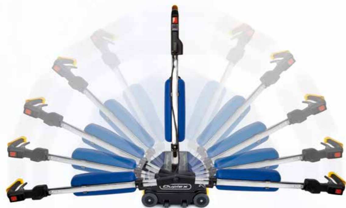
SYSTÈME BIDIRECTIONNEL DE LAVAGE

La machine est équipée d'une poignée d'allumage et d'extinction selon les normes ENEC® et SEV®.