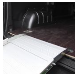
SYSTÈME D'APPUI ANTIDÉRAPANT RÉGLABLE