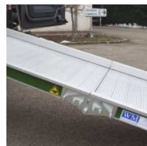
REBORDS DE SÉCURITÉ LATÉRAUX ANTICHUTE (5 cm)