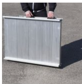
DEUX ROULETTES ET DEUX POIGNÉES DE TRANSPORT