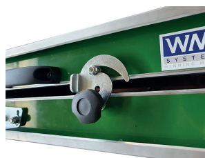
VERROUILLAGE DE LA RAMPE EN POSITION FERMÉE